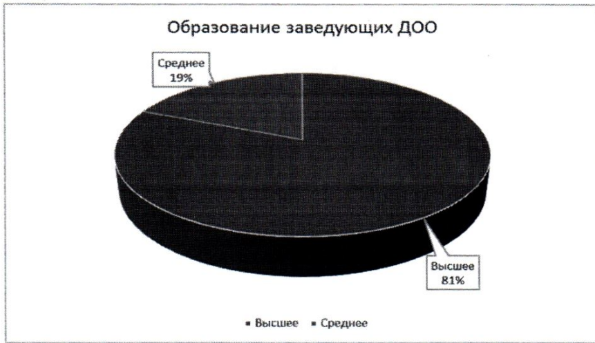
Рис. 1 Диаграмма «Образование руководителей ДОО»