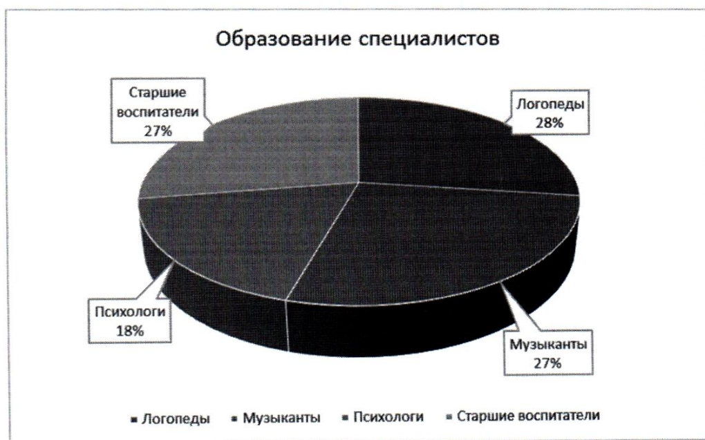
Рис. 4 Диаграмма «Образование специалистов»