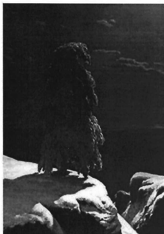
Иван Шишкин. На Севере диком... 1891

Такие задания направлены на выявление специальных предметных компетенций участников. В процессе выполнения задания необходимо провести анализ произведения, выявить его художественную идею, определить средства ее реализации. В задании может быть предусмотрено проведение сравнительно-сопоставительного анализа разнородных (полярных) явлений художественной культуры. Участники олимпиады должны продемонстрировать понимание принадлежности произведения искусства той или иной национальной культуре, эпохе, художественной школе, стилю.