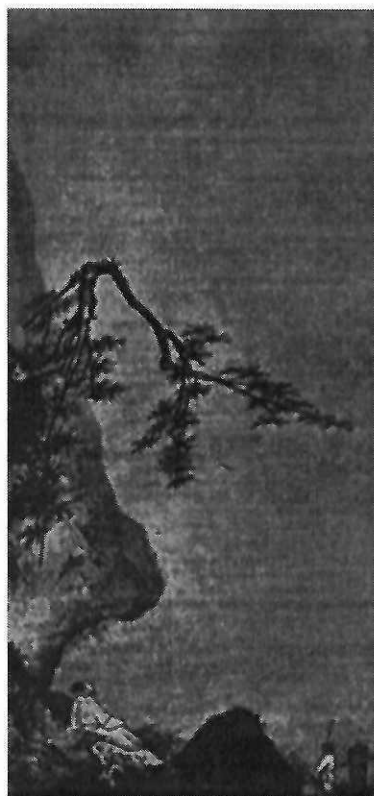
Ма Юань. Лунный свет. Живопись тушью на шелке. XII—XIII вв.